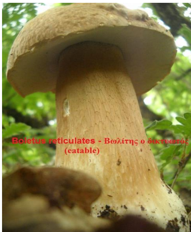
Boletus reticulates – Βωλίτης ο δικτυωτός