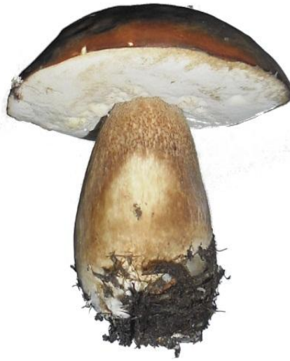
Boletus aereus - Βωλίτης ο χαλκόχρωμος