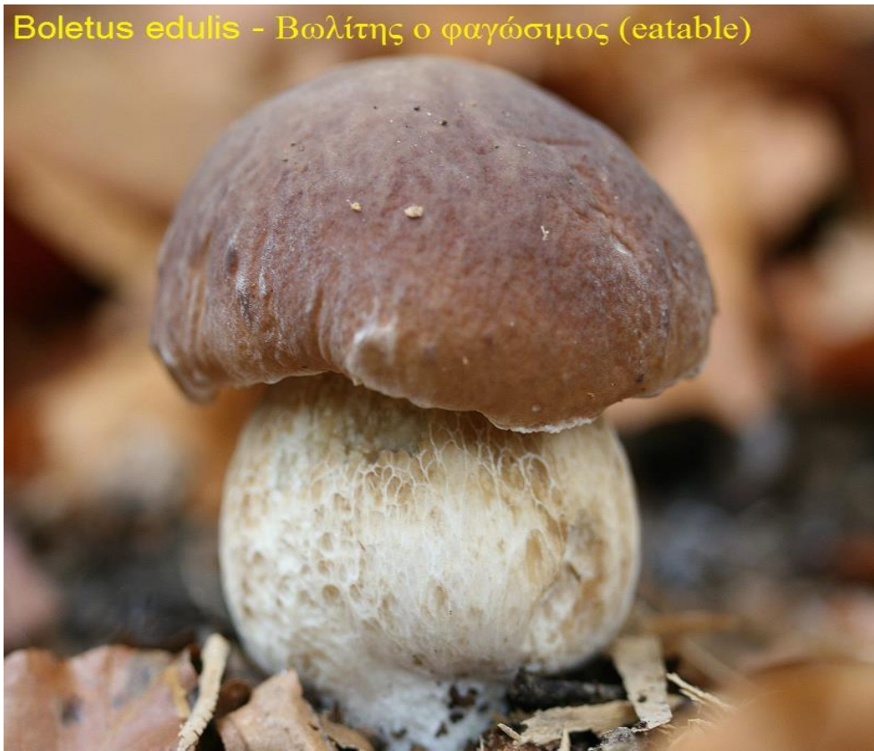
Boletus edulis – Βωλίτης ο φαγώσιμος