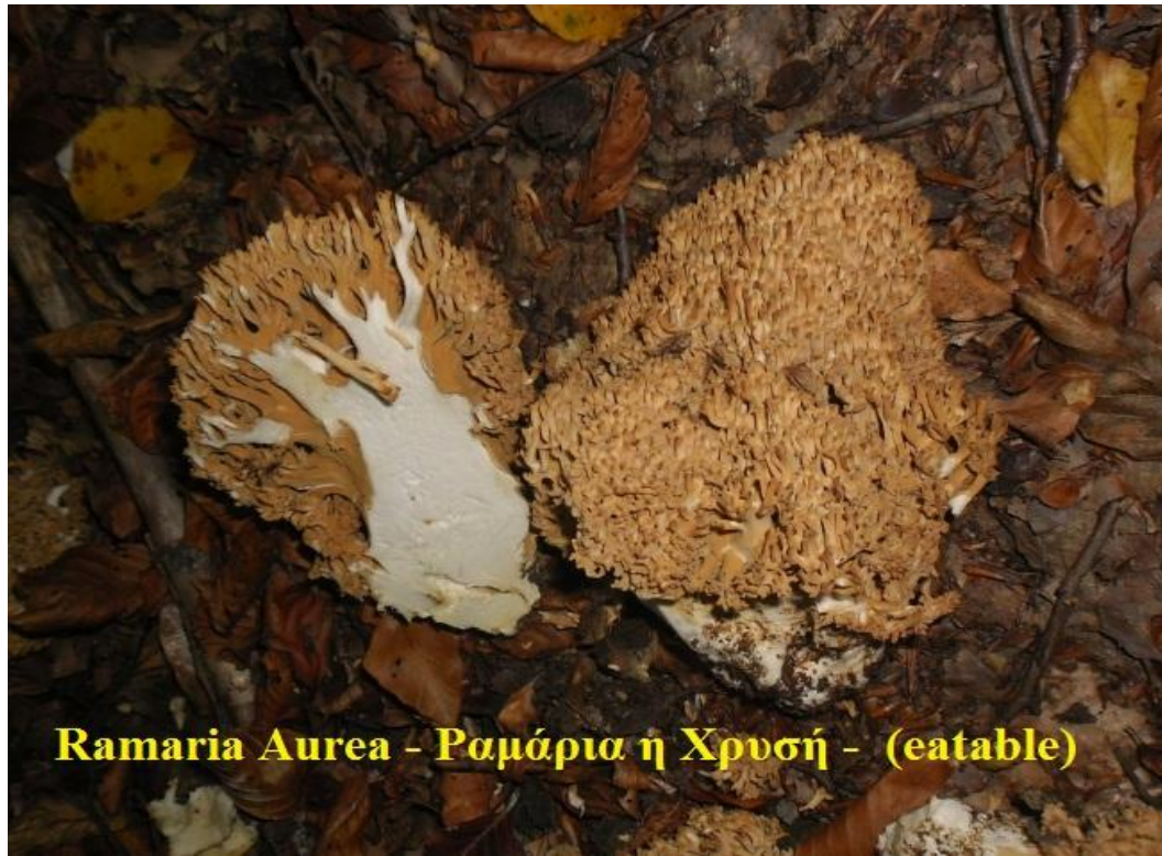
Ramaria aurea - Ραμάρια η χρυσή