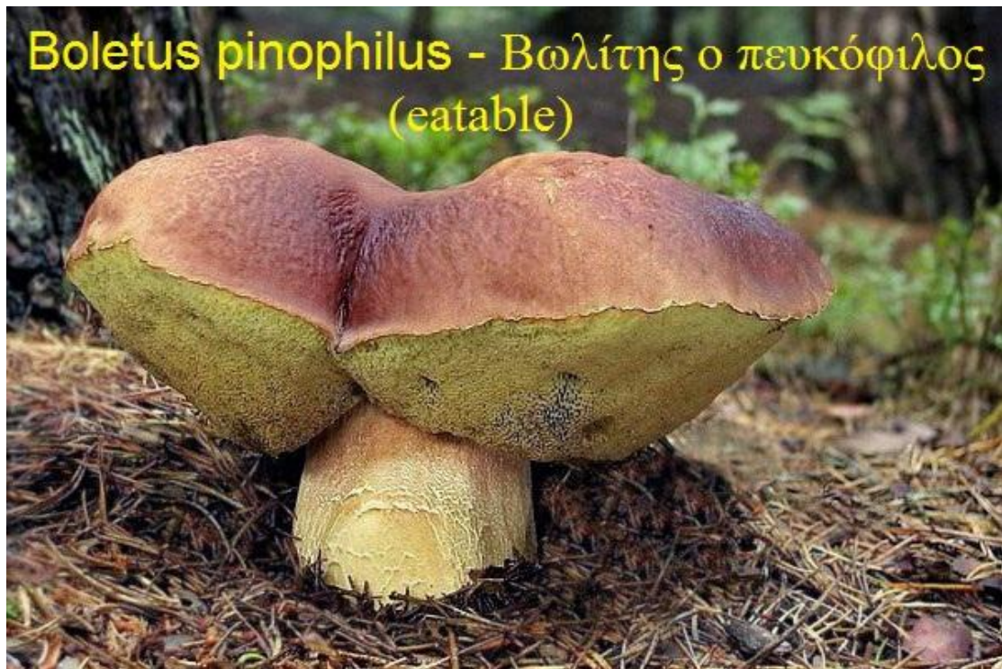
Boletus pinophilus - Βωλίτης ο πευκόφυλλος