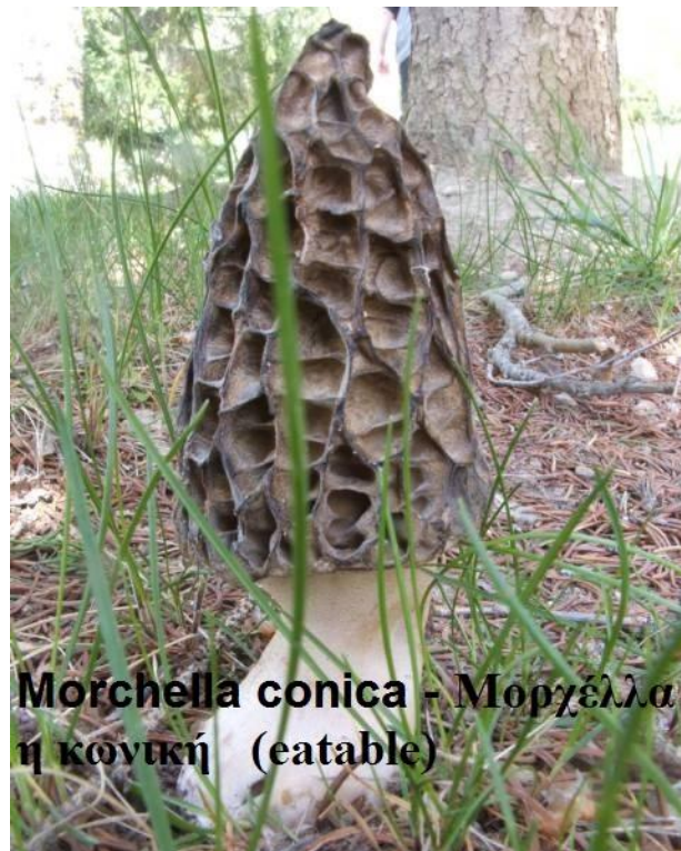
Morchella conica - Μορχέλλα η κωνική (edible)