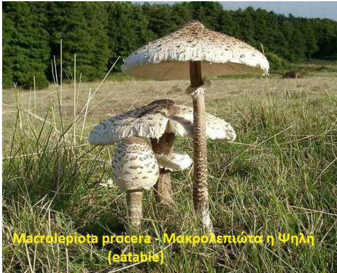
Macrolepiota procera - Μακρολεπιότα η ψηλή