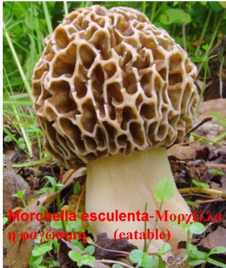
Morchella esculenta - Μορχέλλα η φαγώσιμη