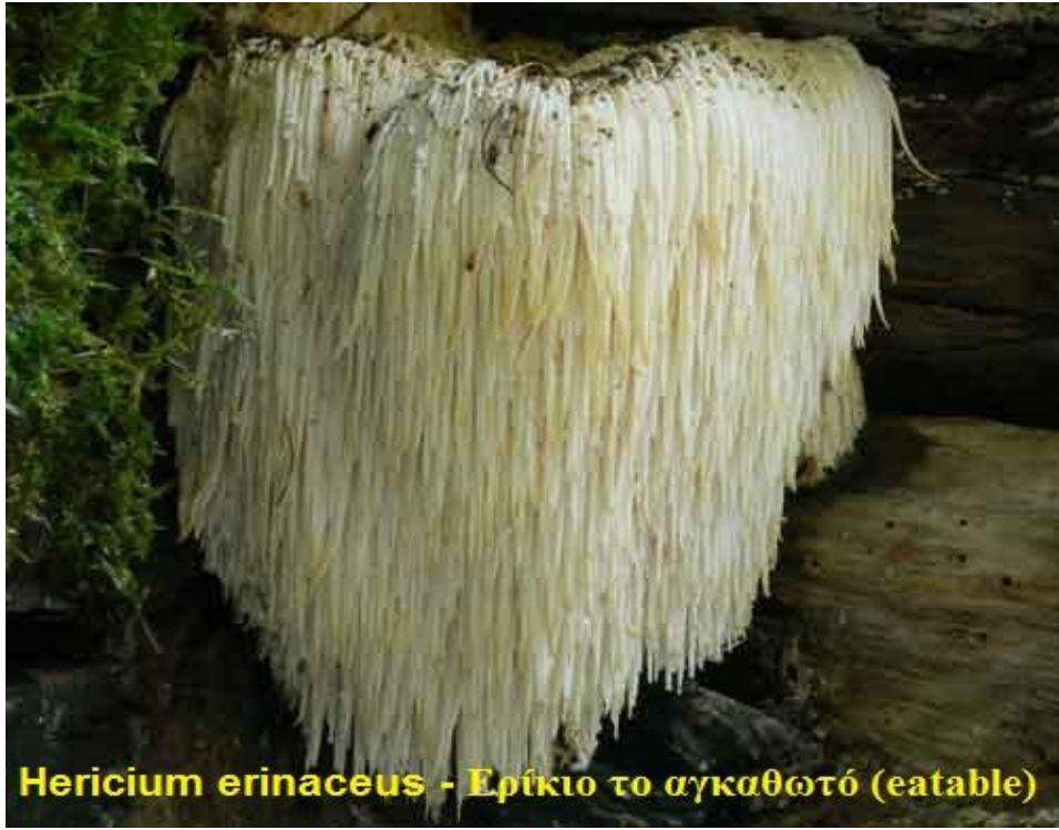
Hericium erinaceus - Ερίκιο το αγκαθωτό (eatable)