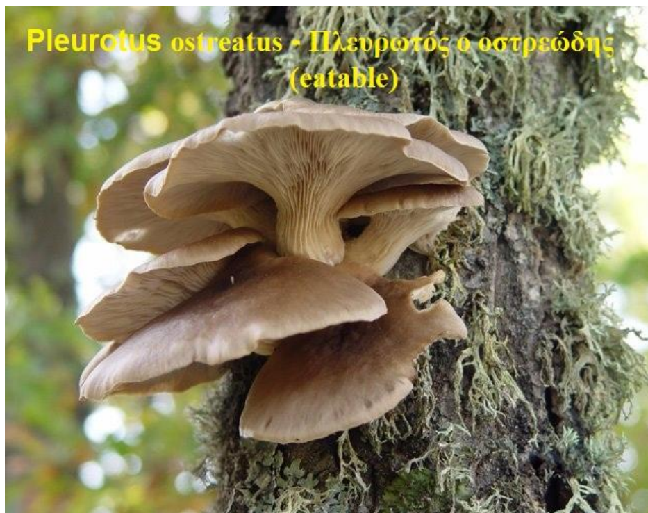
Pleurotus ostreatus – Πλευρωτός ο οστρεώδης