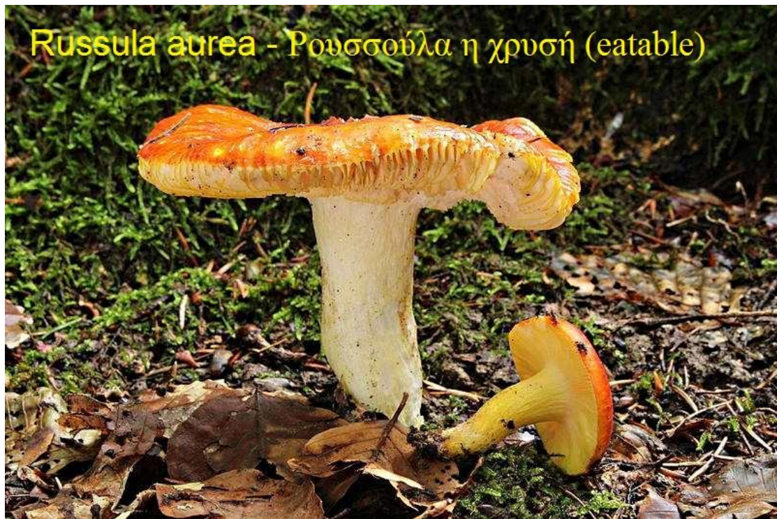
Russula aurea – Ρουσσούλα η χρυσή