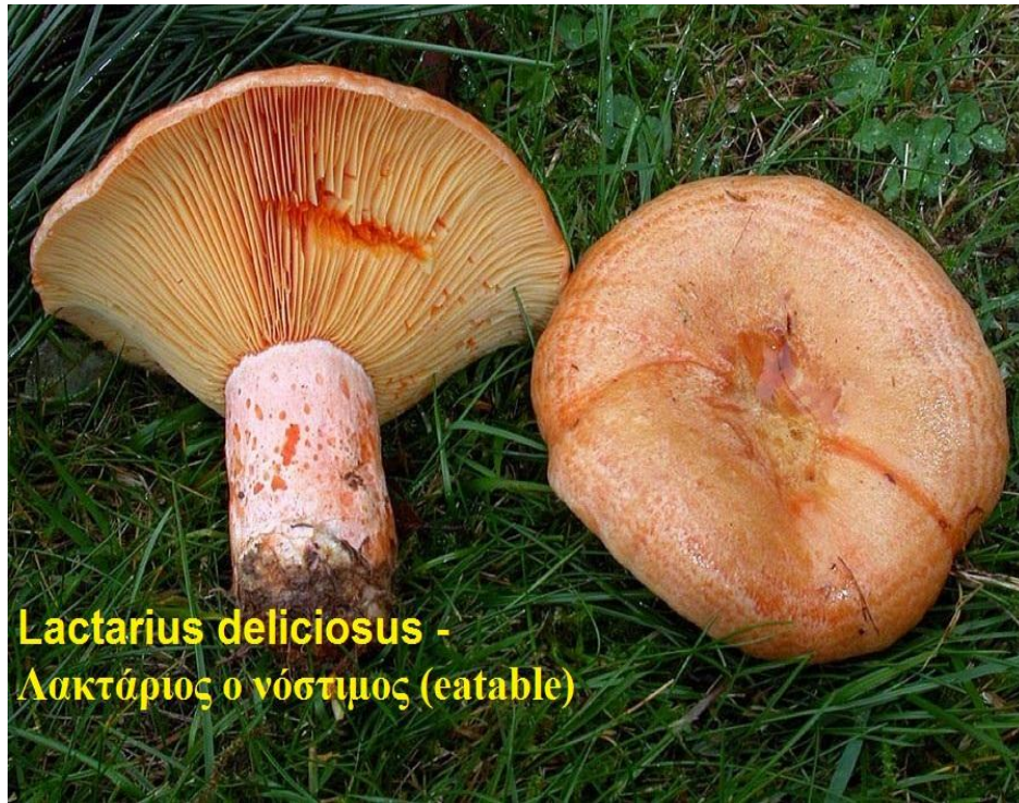
Lactarius deliciosus - Λακτάριος ο νόστιμος (edible)