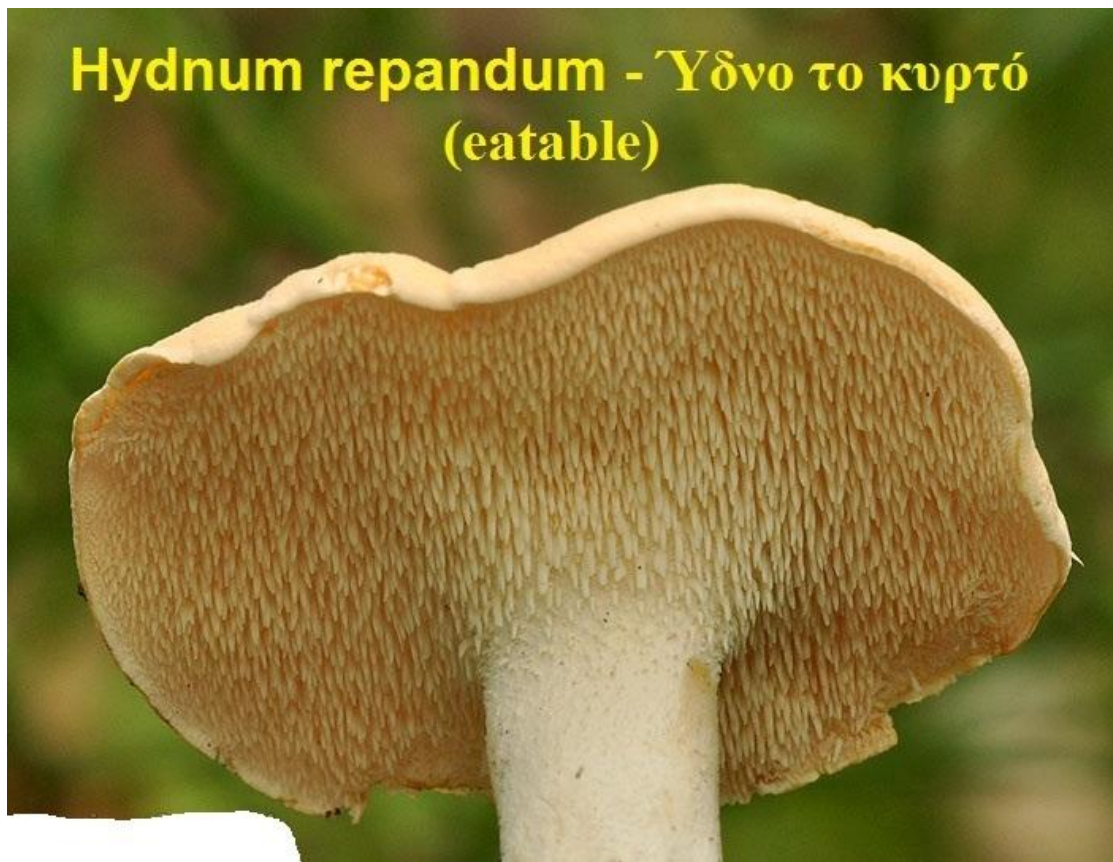
Hydnum repandum - Ύδνο το κυρτό (eatable)